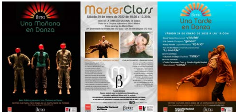
Carteles UMD y UTD 2022

La Asociación desarrolla además de la Muestra, programas como UNA MAÑANA EN DANZA (UMD), programa de actividades extraescolares, dirigido a colegios de la Comunidad de Madrid, cuyo objetivo es educar a las audiencias del futuro y al que han asistido, desde su primera edición en febrero 2015, más de 18.000 alumnos y profesores. UNA TARDE EN DANZA es el programa gemelo que extiende la experiencia de UMD al público en general.